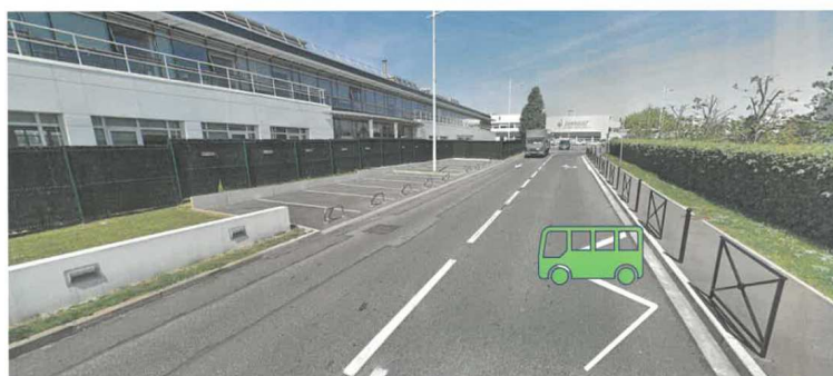
Arrêt temporaire pendant l'expérimentation