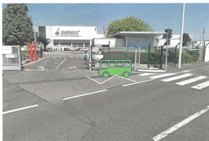
Arrêt temporaire pendant l'expérimentation