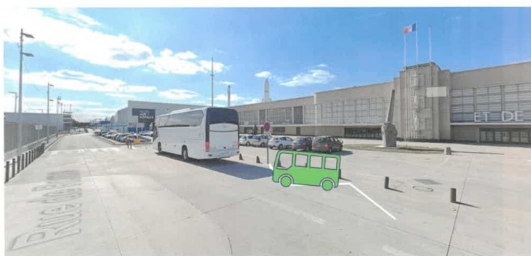
Arrêt hors voirie