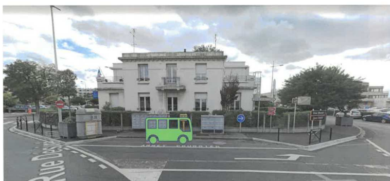
Arrêt hors voirie